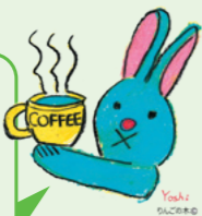
JOY! ソライロ 公式LINE

このうさぎは、地域活動支援センター「りんごの木」のメンバーさんのイラストから生まれたよ! (詳しくは公式LINEを見て下さいね)