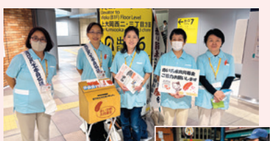
街頭募金活動は民生委員 児童委員協議会・助成金 受配団体・障害当事者団 体に協力いただきました。 (順不同・敬称略)